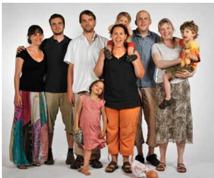
Participants romands au cours pour les partants de l'été 2010. Aujourd'hui, ils sont tous dans leur nouveau pays d'accueil.

volontaires. Sans compter que ce même jour, dans la maison, on pouvait aussi entendre de l'italien, de l'allemand, et même du chinois!