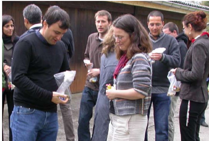
Les participants font connaissance: mini-entretien 2 à 2 puis un échange de bonbons. On se retrouve au final avec 20 bonbons de couleur différente; beau symbole de la richesse d'un groupe varié.

Ainsi, lors de nos formations, nous utilisons toute une série de méthodes participatives, laissant une grande